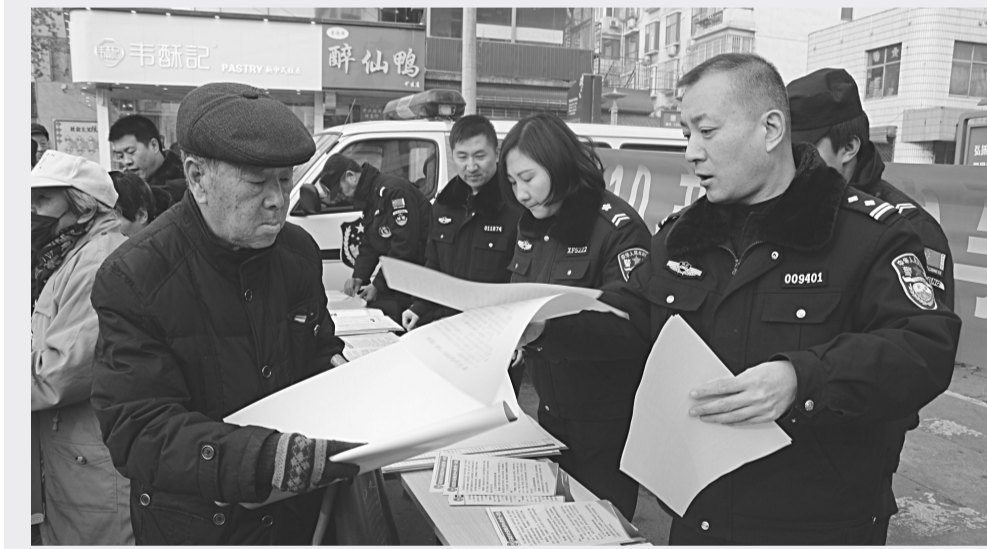
1月10日,石家庄市公安局井陉矿区分局组织民警开展了以“不忘初心110,共建共治享安宁”为主题的集中宣传活动。在现场,民警通过发放传单、现场咨询的形式,宣传110接报警知识、便民利民措施、安全防范知识和打击违法犯罪等内容,教育群众珍惜110资源,杜绝奇葩报警和扰警行为。