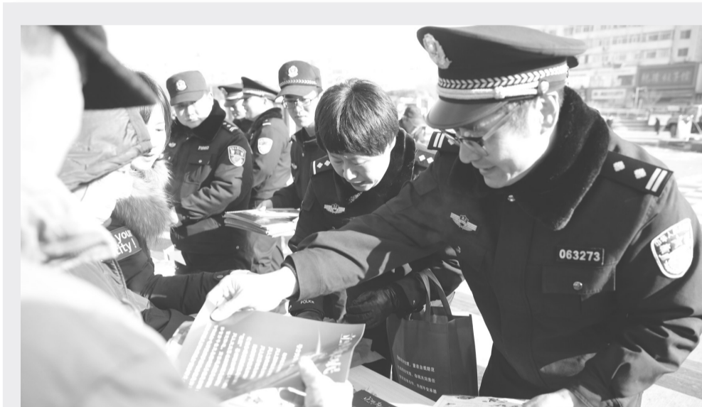
今年1月10日是全国第34个“110宣传日”,承德市公安局组织开展“不忘初心110,共建共治享安宁”为主题的宣传活动。民警走进承德市中心广场开展法律宣传,介绍110社会联动常识,教群众如何识别电信诈骗,为群众现场答疑,受到群众欢迎。