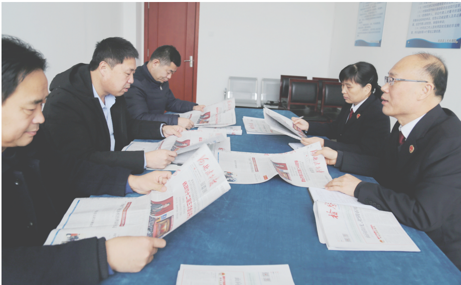
鸡泽县人民检察院高度重视接受社会监督工作,不断加强和人民监督员的工作联系,为人民监督员开展工作创造条件。进入新的一年,该院为驻辖区的人民监督员赠订了《河北法制报》。图为近日该院检察官、干部与人民监督员一同通过《河北法制报》学习省“两会”精神的场面。