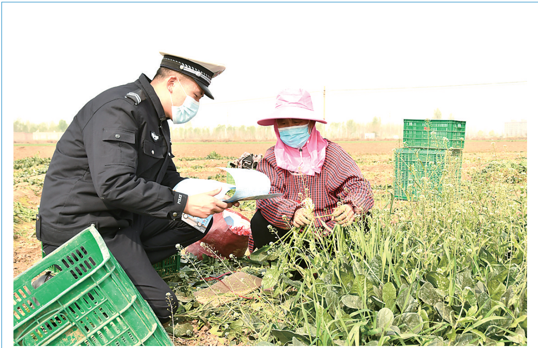
为进一步筑牢农村道路交通安全防线,连日来,正定县公安局交通管理大队深入田间地头,开展春季交通安全宣传活动。民辅警针对春耕农忙时节,驾驶人农忙劳累、身体疲惫时出行存在的交通安全隐患,向村民们讲解酒驾醉驾、超员超载、驾乘电动自行车不戴头盔、农用车违法载人等交通违法行为的危害,号召广大村民自觉抵制交通违法行为,积极宣传交通安全常识。图为该大队辅警为村民发放宣传材料。

观。 法官提醒 互联网并非法外之地,朋友圈也并非单纯的私人空间。在社交媒体中为泄愤逞一时口舌之快,不仅不利于解决问题,反而容易激化矛盾,也易产生侵权问题。任何人都应当以理性、客观、公正和谨慎的态度在合理限度内发表网络言论,不得侵害他人的合法权益,不得违反法律规定,不得损害国家安全、公序良俗等公共利益,时刻注意谨言慎行。