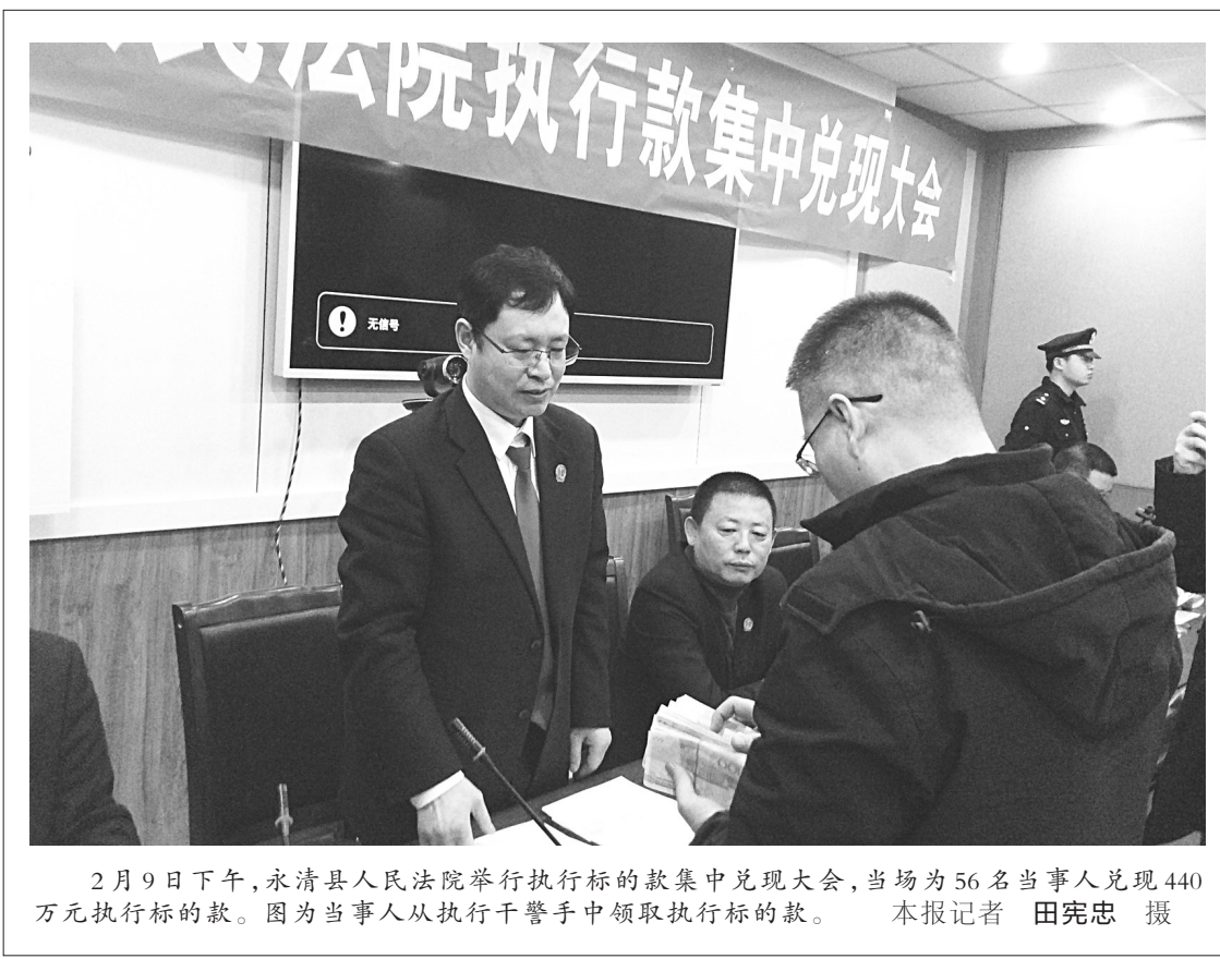
2月9日下午,永清县人民法院举行执行款的款集中兑现大会,当场为56名当事人兑现440万元执行标的款。图为当事人从执行干警手中领取执行标的款。