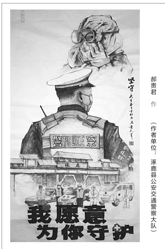
郝贵君 作 (作者单位：涿鹿县公安交通警察大队)