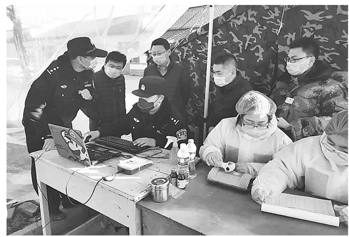
疫情当前，为应对复工复产期间人员、车辆增多的现状，故城县公安局强化科技信息手段在疫情防控中的应用，采取30秒可完成一人登记的身份证电子登记和二维码“扫码登记”等非接触式登记方式，有效降低了通过使用纸笔物品产生交叉感染的可能，提高了检测效率。

驻村工作队积极配合贫困村“两委”班子，坚持防控关口前移，在村庄出入口设卡，细致排查流动人员并劝导走亲访友人员、车辆返回。动员村内党员干部，成立党员突击队，设立党员服务岗，带领党员干部分班设岗，全天候值守在村内主要入口，为群众建立起疫情防控第一道防线。同时，认真入户排查，逐一做好返乡人员登记工作，建立来往人员登记台账。加强对出入人员的管控，严格落实登记制度，劝导本村群众减少外出，严控外来人员进入，守好群众健康安全关。