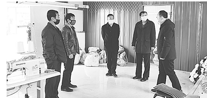
近日,唐县人民检察院党组书记、检察长徐文科带队,深入辖区民营企业,了解和协助解决企业在复工复产中遇到的难题,指导企业做好疫情防控相关工作,为企业复工复产提供优质的法治保障。图为徐文科在企业车间内了解复工复产情况。