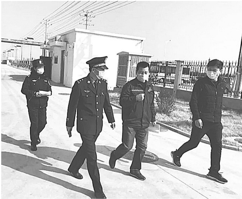
图为沧州市警进入辖区企业沟通对接、主动服务。

临港经济技术开发区规模以上企业127家近9000名产业工人将分批次复工,渤海新区公安分局临港经济技术开发区派出所提前搭建警企交流微信群等互动交流平