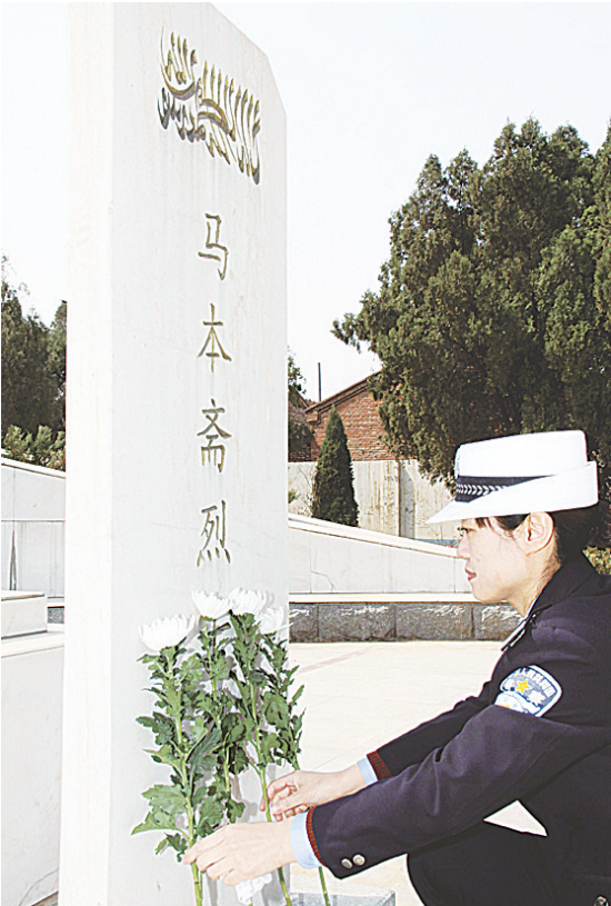
清明来临前，沧州市交警支队组织民辅警对革命英烈进行追思活动，以此缅怀为新中国献出宝贵生命的人民英雄。图为一名女民警正在马本斋烈士墓碑前献花。