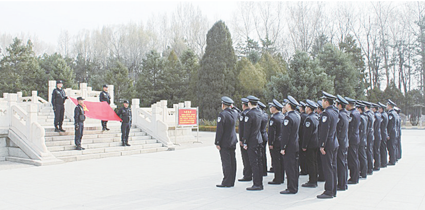
清明节前夕，隆化县公安局组织民警到董存瑞烈士陵园祭奠英雄，激发民警的革命英雄主义和爱国主义情怀。