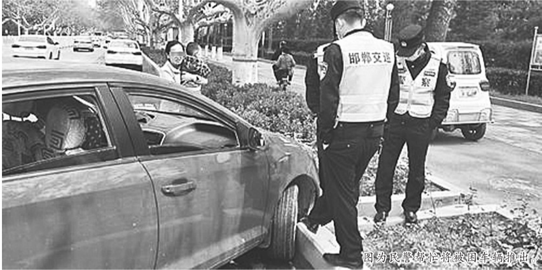
图为民警帮忙将被困车辆推出。

河北法制报讯 (记者 李建华 通讯员 于金刚)邯郸一女子驾驶汽车拐弯掉头时,不慎将车轮卡在路边和便道之间的缝隙里无法动弹,慌乱之际恰好遇见巡逻至此的邯郸交巡警,在他们帮助下才解除了困境。