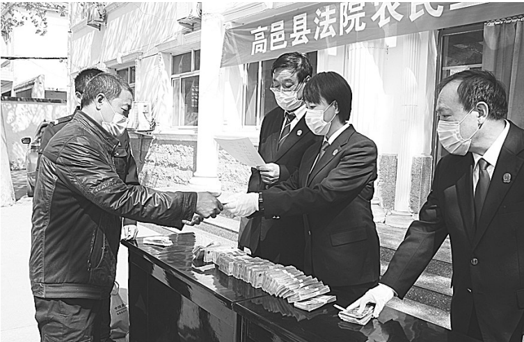
图为高邑法院院长张静为工人发放工资款。

因该企业未能如期履行给付工资义务,案件进入执行程序。执行过程中,院党组多次专题研究化解方案,院长每周听取办案进度汇报,亲自到现场进行督办,始终与工人代表保持电话、短信联系,及时向工人通报案件进展情况,在保障