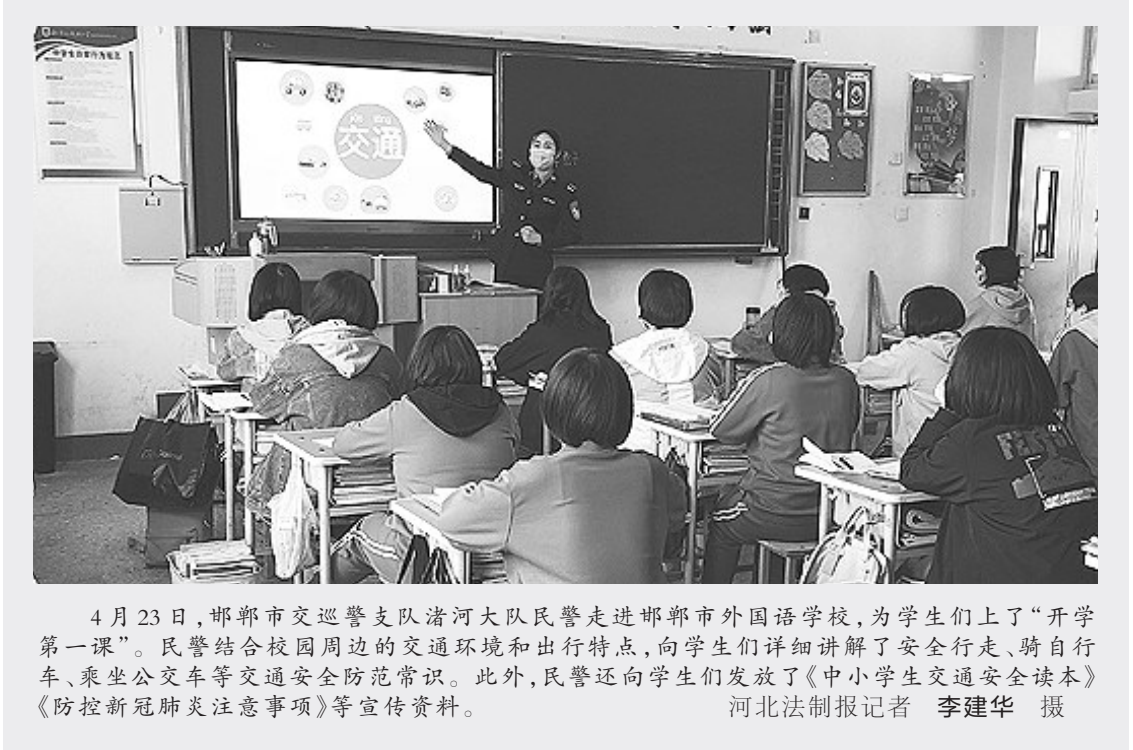
4月23日，邯郸市交巡警支队清河大队民警走进邯郸市外国语学校，为学生们上了“开学第一课”。民警结合校园周边的交通环境和出行特点，向学生们详细讲解了安全行走、骑自行车、乘坐公交车等交通安全防范常识。此外，民警还向学生们发放了《中小学生交通安全读本》《防控新冠肺炎注意事项》等宣传资料。