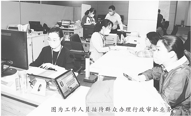
图为工作人员接待群众办理行政审批业务

“凡无法律、法规和规范性文件依据的一律取消!同一事项无差别受理、同标准办理!”行政审批局对行政许可事项名称、编码、依据、类型等内容进行统一和完善,依法依规核定审批要件,规范踏勘要点。该局将行政审批的受理、踏勘、审批三权分离,实行“事权分离、人员独立、分段管理、分权制衡”,厘清权力边界,从源头上杜绝权力寻租。通过制发《石家庄市行政审批局行政审批责