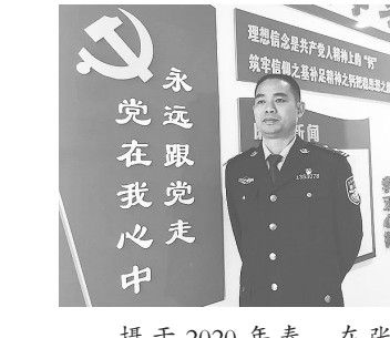
摄于2020年春,在张家口市司法局。

手,在工作中认真钻研业务,研究工作策略,做到工作思路清晰,业务精通,有的放矢地开展工作,很好地履行了职责,多次受到表彰。2020年初,我被司法部通报表彰为全国司法行政系统特赦实