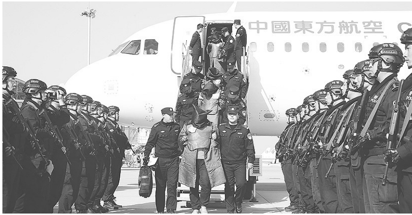
2019年11月14日,208名电信网络诈骗犯罪嫌疑人被我省警方从菲律宾包机押解回国。 河北法制报记者 韩志强 摄 (资料图片)

全省公安机关持续推进“放管服”改革,深入开展“三深化三提升”活动,深化户籍制度改革,推出22项交管“放管服”改革新举措、(下转第6版)