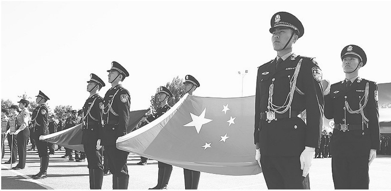
全省公安机关国庆70周年安保誓师大会上,公安民警英姿勃发。 (资料图片)

——围绕扫黑除恶专项斗争2019年“深挖根治”、2020年“长效常治”的工作目标,聚焦重点地区、行