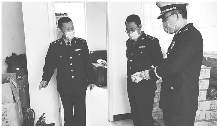
近日,兴隆县市场监督管理局开展消防器材整治专项行动,重点检查灭火器、消防水带、消防栓箱等消防器材经营单位,查看是否有经营资质、符合市场准入条件、通过国家强制性认可等,重点宣传消防器材进货注意事项和假冒伪劣消防器材的危害等。此次行动中所查的消防器材全部合格。

通过此次活动,社区矫正对象再次深刻体会到母亲的不容易以及对孩子无私的爱,进一步增强了社区矫正对象对父母长辈的尊重感谢,唤醒他们潜藏在内心深处的感恩之心,帮助他们以更好的精神面貌融入社会。