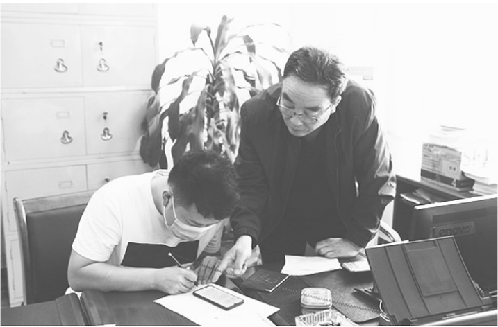
安某的儿子在法院办理相关手续。

2018年,安某在与人咨询时,了解到因15人中有1人籍贯是新乐,可以在新乐法院起