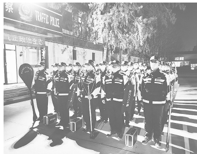
整交期间,开展夜查成为常态,机动大队民辅警整装待发。

随着复工复产节奏的加快,交通流量骤增,酒驾、醉驾等各类违法行为为抬头,石家庄市公安局交通管理局机动大队按照市交管局整交指示精神,根据局党委统一安排部署,充分发挥灵活、机动的特点,异地用警,对石家庄周边县、区进行多轮次的酒驾等违法行为查处。 每次行动,机动大队都邀请媒体随行,并且进行网络直播,加大宣传力度,大大减少了执法干扰,有效遏制了各类交通违法行为的发生,为群众出行创造了一个安全的道路交通环境,受到群众好评。