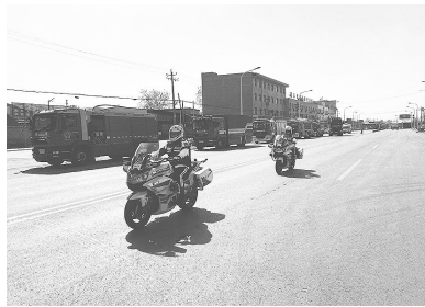
机动大队骑警一路保障消防车快速抵达火灾现场。

3月10日上午,正定县火车站附近某化工厂的一个仓库突发火灾。接到命令后,石家庄市公安局交通管理局机动大队立即出动10名“650”摩托车手前往火灾现场。 到达现场后,机动大队骑警立即扩大交通管制区域,同时疏导车辆、劝离围观群众,确保附近人员安全,为消防车顺利抵达起火现场提供了有力保障。 经过交警和消防人员的不懈努力,及时扑灭火灾,保障了附近居民群众生命和财产安全。