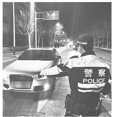
在重点路段,机动大队民警在对过往车辆逐一进行严查。