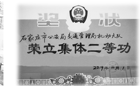
▲2019年11月1日,石家庄市公安局交通管理局机动大队因工作成绩突出,荣立省公安厅集体二等功。