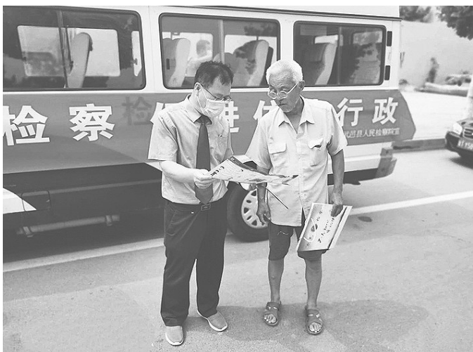
图为工作人员向群众宣传检察业务知识。

河北法制报讯（吕云云）6月28日上午，武邑县检察院第二检察部干警深入乡镇集市，开展以“做实行政检察、促进依法行政”为主题的行政检察宣传活动。