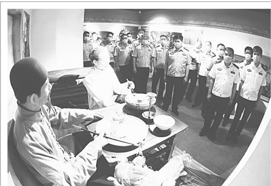
7月6日,河北出入境边防检查总站组织机关全体党员民警,到正定县塔元庄村开展“追忆入党初心 担当新时代重任”主题党日活动,通过参观塔元庄的村容村貌和党员教育基地、重温入党誓词等活动,了解了近几十年来塔元庄村翻天覆地的变化和村民们欣欣向荣的生活景象,深刻感受到了党的农村政策带来的喜人变化。图为民警在党员教育基地参观。