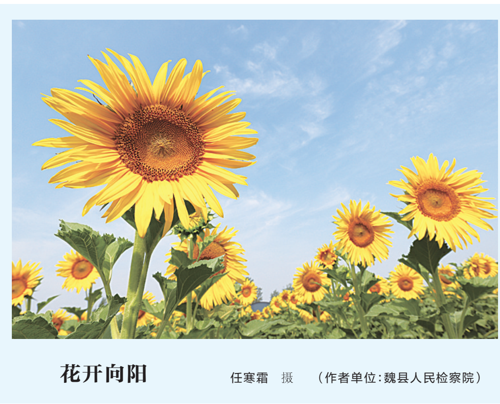
花开向阳 (作者单位:魏县人民检察院)