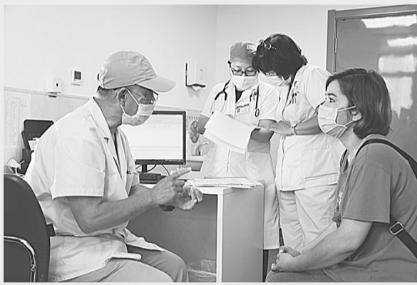
儿科、肾内科等相关专家会诊。