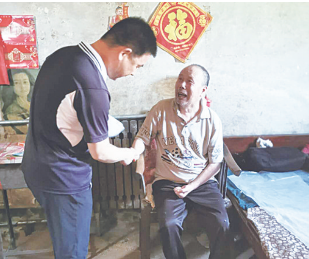
图为石家庄中院干警走访帮扶户。

戴景月从讲政治、强学习、守规矩三个方面对新入职、晋升人员提出期望与要求。要旗帜鲜明讲政治，强化政治理论学习，矢志不渝做中国特色社会主义法治的忠实崇尚者、自觉遵守者、坚定捍卫者；要科学严谨强学习，在新的起点上，对自己高标准、严要求，逐步养成严谨细致的学风，高效踏实做好本职工作，有效推动法院整体工作；要坚定不移守规矩、勇担当、