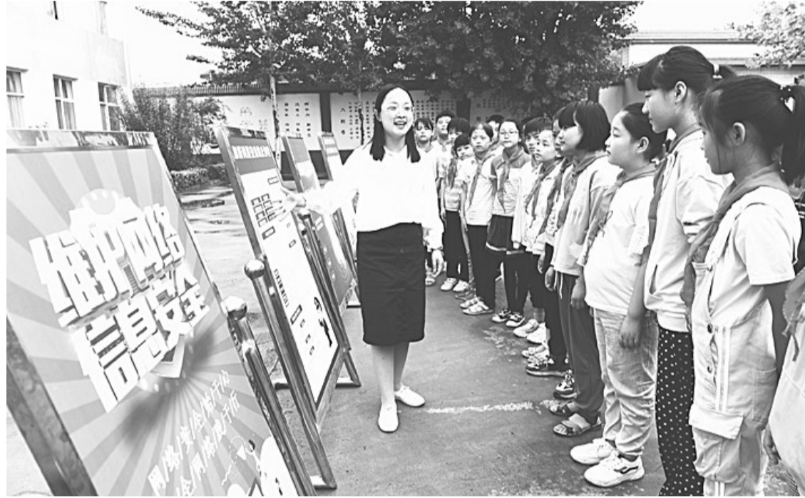
为进一步普及网络安全知识,增强学生们网络安全意识和防护意识,新乐市各学校通过线上网络公开课、设置“网络安全在我身边”微话题,开展“我与网络安全”微视频、微网文校园征集和网络安全知识竞赛等活动,营造健康绿色文明的校园网络环境。图为9月15日,新乐市西岳村小学老师通过展板为学生讲解网络安全知识。