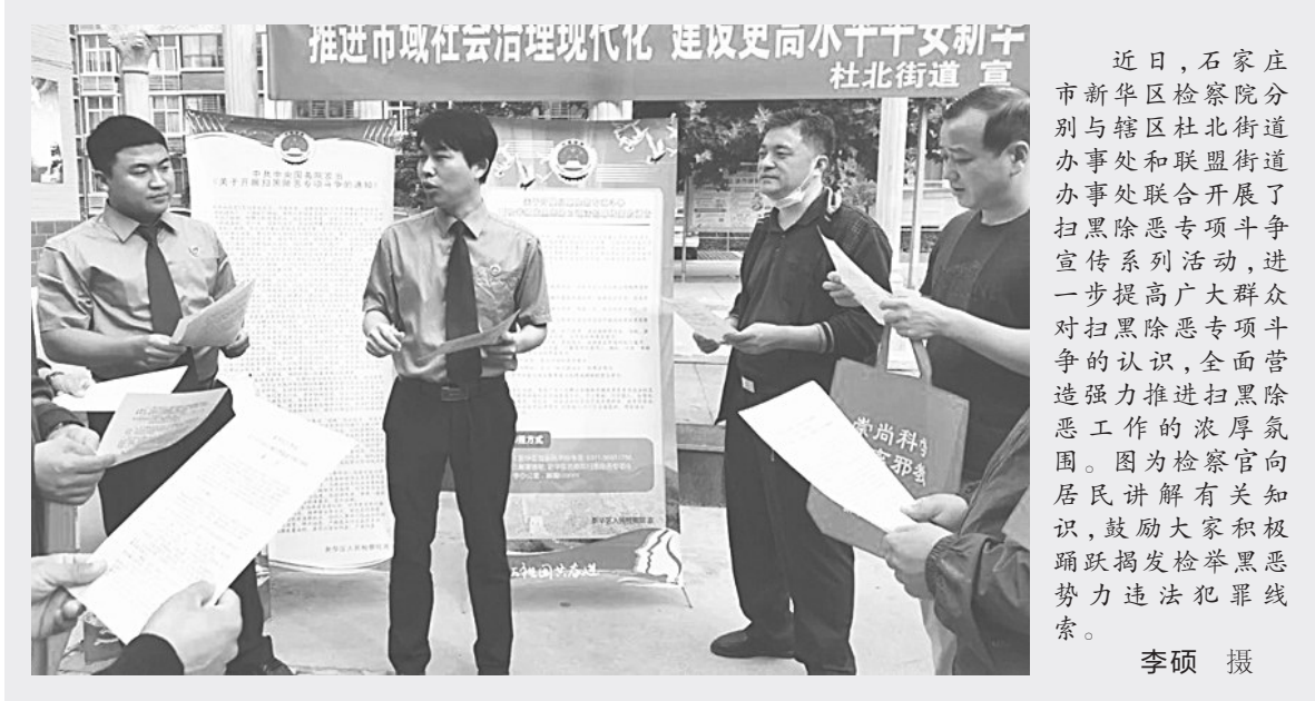
近日，石家庄市新华区检察院分别与辖区杜北街道办事处和联盟街道办事处联合开展了扫黑除恶专项斗争宣传系列活动，进一步提高广大群众对扫黑除恶专项斗争的认识，全面营造强力推进扫黑除恶工作的浓厚氛围。图为检察官向居民讲解有关知识，鼓励大家积极踊跃揭发检举黑恶势力违法犯罪线索。

据悉，此次“法律讲堂进社区”活动着重以法律视角审视日常活动，引导群众自觉参与法治社区和美好家园的建设，营造文明谦让、和谐共赢的社会氛围，力促全民共建文明城。