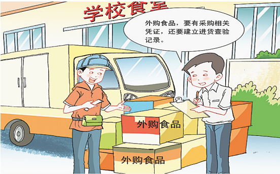
外购食品的学校，应当索取食品采购相关凭证，建立进货查验记录，按照保证食品安全的要求贮存食品。应当利用公共信息平台等方式向学生、教职工及学生家长或者监护人公开食品进货来源、供餐单位等信息。