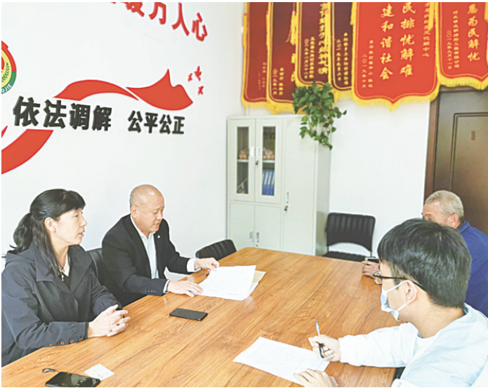
图为发挥余热走上调解岗位的“帮大哥帮大姐”现场为群众调解纠纷。

“莫道桑榆晚,为霞尚满天。”虽年过花甲,但他们依然活跃在基层的调解一线,不计名利,不畏辛劳,将调解触角延伸到田间炕头、群众心间,成为正定大地上一片亮眼的“夕阳红”。