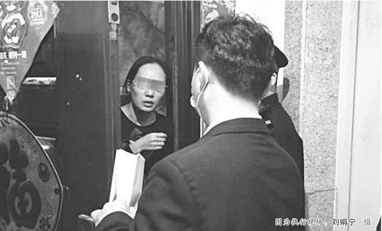
图为执行现场。刘娟宁 摄

职能、做好‘六稳’工作、落实‘六保’任务”专项执行行动的一项重要内容。安平法院将继续深入开展专项执行行动，持续加大对关于涉黑恶刑事涉财执行案件、职务犯罪刑事涉财执行案件、涉民生案件、违法占用耕地类行政非诉执行案件、党政机关国有企业拖欠民营企业中小企业债务案件的执行力度，着力贯彻善意文明执行理念，保障胜诉当事人的合法权益。