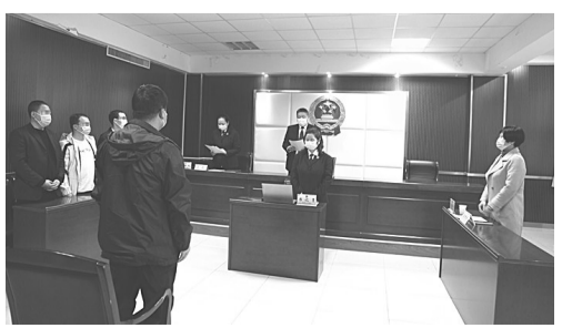
图为检察人员进行公开宣告。

此次不起起诉公开宣告是检察机关服务区域经济发展,扎实做好“六稳”工作、落实“六保”任务的具体举措。竞秀区检察院在法律规定范围内少捕、慎诉,同时及时帮助企业防范风险、化解矛盾纠纷,在坚持依法办案的同时,最大限度地保证社会效果和法律效果的统一,受到企业欢迎。