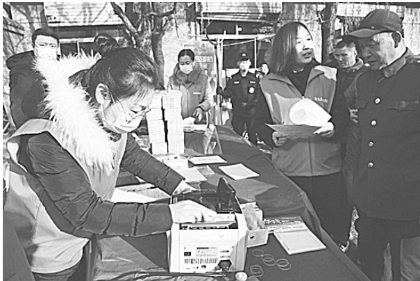
保定农商银行工作人员现场为村民清点现金,为村民普及金融知识。

“红马甲”服务队细分为场内发放、场外宣传、接款车辆、现金押运、网点服务、金库清点等小组,各支行在全行各部室的全力支援与协同合作下,多方面、全方位地落实征地拆迁补偿资金的服务工作。保定农商银行将“一条龙”服务延伸到家家户户,从排队叫号到签约确认,从资金发放到网点留存,为村民定制了专属的“特色服务”,充分发挥灵活快捷的服务特色,极大地满足了村民们的业务办理需求,为村民提供了方便、快捷的金融服务。