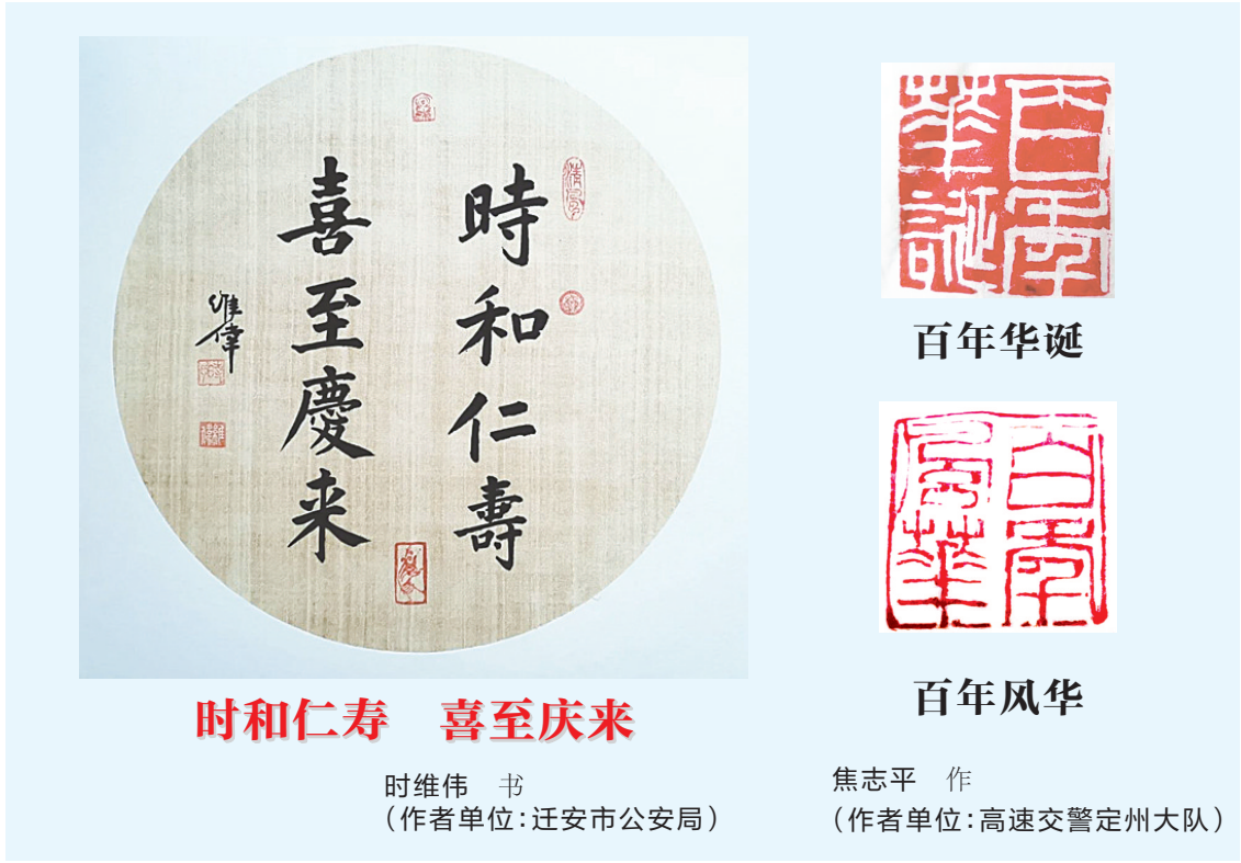
时和仁寿 喜至庆来