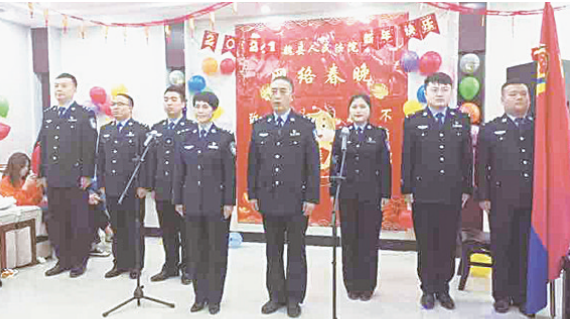
图为魏县法院法警队合唱《让世界充满爱》。