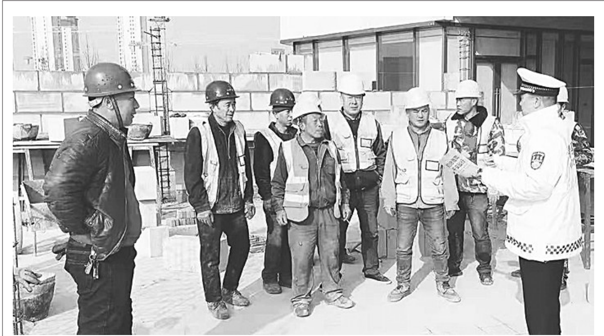
为进一步深化“减量控大”工作,从源头上预防和减少道路交通事故的发生,3月份以来,唐山市丰南区公安交警大队结合辖区各工地春季开工实际,组织警力对进城务工人员这一特殊群体开展了春季交通安全宣传活动。截至目前,该大队民警共深入19个施工工地发放宣传资料7200余份,接受群众咨询16次,受教育务工人员达7700余人。