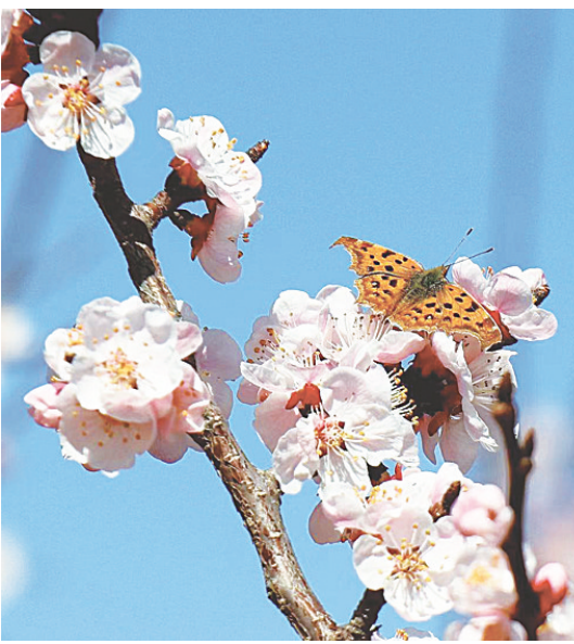
嗅春 唐盈盈 摄 (作者单位:吴桥县人民法院)

由于工作变动等多种原因,我们之后没能再去看望小荣,但多年来,小荣当年的不幸遭遇及家中的困境一直时时浮现在我们眼前,让我们久久不能忘怀。直到今天,我们都在心底期盼着:小荣,你要生活得好好的,你要得到和他人一样的快乐和幸福!