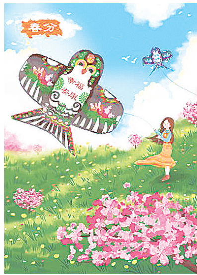
放风筝 新华社发 元六六 作

中国艺术必须在继承中创新,向现代化形式演进,以适应新时代发展的需要。正如李可染先生所言,“以最大的功力打进去,再以最大的勇气打出来”。所以,放飞艺术的风筝,一头连着传统文化,一头飞向当代世界的晴空;一头连着民族的文化信仰,一头连着艺术家的志趣。任你是龙凤,或者是麻雀燕子,线有多长飞得多高多远,只要始终保持风筝不断线,就能接地气、聚灵气、冒仙气。