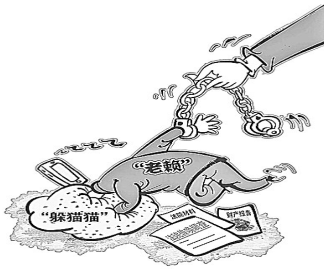
“躲不过” 新华社发 商海春 作

在实践中,对于该项罪名中“情节严重”的衡量,《最高人民法院关于审理拒不执行判决、裁定刑事案件适用法律若干问题的解释》进行了明确:具有拒绝报告或者虚假报告财产情况、违反人民法院限制消费令及有关消费禁令等拒不履行行为,经采取罚款或者拘留等强制措施后仍拒不执行的;伪造、毁灭有关被执行人履行能力的证据,以暴力、威胁、贿买方法阻止他人作证或者指使、贿买、胁迫他人作伪证,妨碍人民法院查明被执行人财产情况,致使判决、裁定无法执行的;拒不交付法律文书指定交付的财物、票证或者拒不迁出房屋、退出土地,致使判决、裁定无法执行的;与他人串通,通过虚假诉讼、虚假仲裁、虚假和解等方式妨害执行,致使判决、裁定无法执行的;以暴力、威胁方法阻碍执