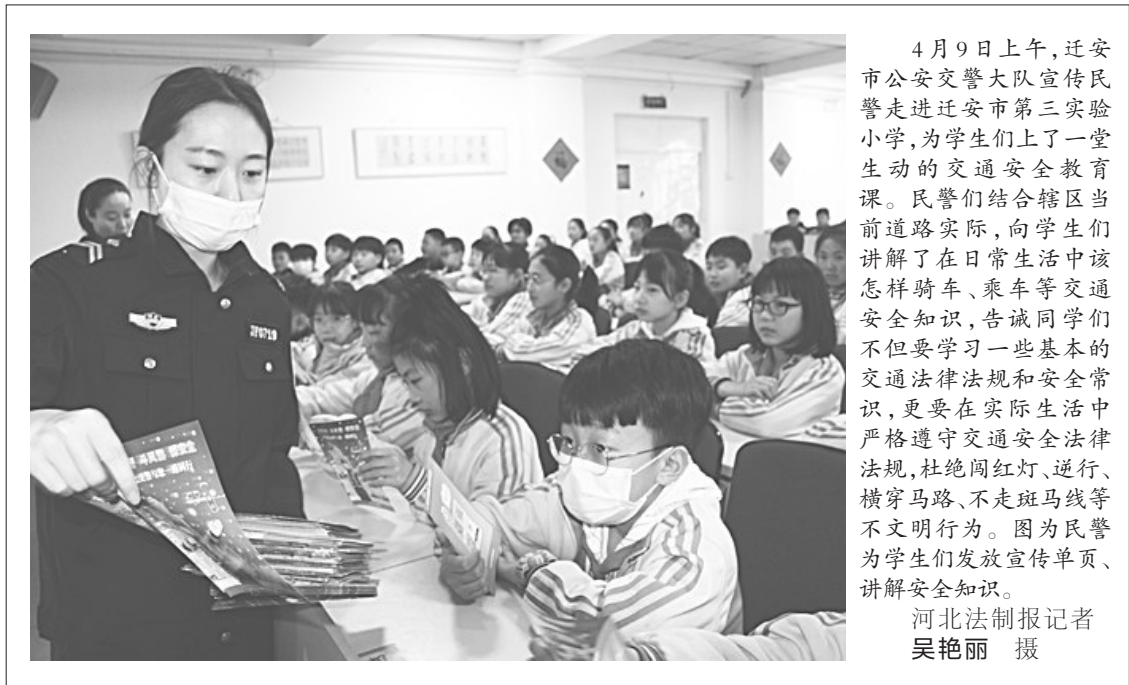
4月9日上午,迁安市公安交警大队宣传民警走进迁安市第三实验小学,为学生们上了一堂生动的交通安全教育课。民警们结合辖区当前道路实际,向学生们讲解了在日常生活中该怎样骑车、乘车等交通安全知识,告诫同学们不但要学习一些基本的交通法律法规和安全常识,更要在实际生活中严格遵守交通安全法律法规,杜绝闯红灯、逆行、横穿马路、不走斑马线等不文明行为。图为民警为学生们发放宣传单页、讲解安全知识。

近日,故城县人民检察院召开队伍教育整顿座谈会,邀请县人大代表、政协委员、律师等各界代表参加,征求对检察工作和队伍教育整顿的意见建议。党组书记、检察长朱同辉在座谈会上表示,队伍教育整顿将突出民意导向,全面梳理意见建议,认真做好责任分解,扎实抓好问题整改,确保取得实效。图为座谈会现场。