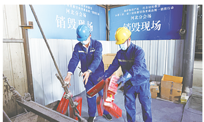
图为销毁假冒伪劣商品现场。

侵权假冒工作领导小组及成员单位认真履行职责,加大知识产权保护力度,严厉打击侵权假冒行为,为维护市场经济秩序、促进经济社会高质量发展作出了积极贡献。2019年、2020年我省打击侵权假冒工作考核连续两年A类优秀,位列全国前列。新冠肺炎疫情发生以来,全省各级各有关部门强化防疫物资生产、销售和出口等质量安全监管,扎实开展专项整治行动,有效遏制了侵权假冒违法行为,保证了市场秩序持续稳定,为满足防疫和民生物资需要、统筹疫情防控和经济社会发展提供了有力保障。