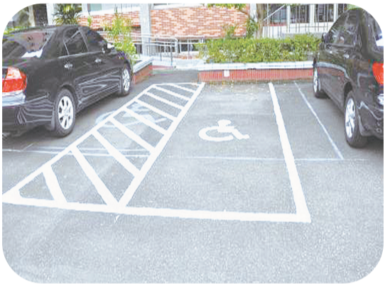
图为残疾人专用车位。