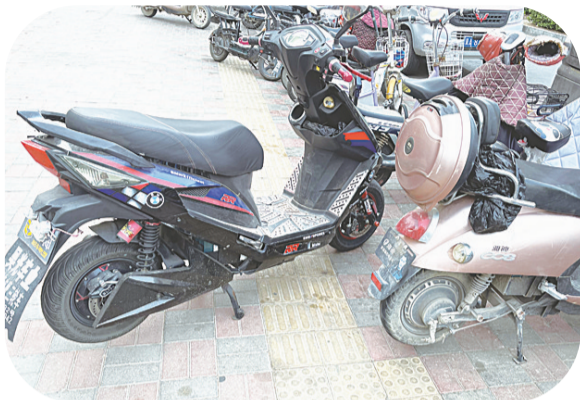
图为市区盲道被占用。