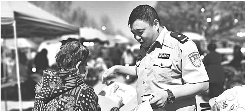
图为大队民警在进行宣传。

车管所交警不失时机地向前来办理业务的群众发放“便民服务卡”和“车驾管业务明白卡”。明白卡上清楚地标明了办理各类车驾管业务需要的材料,并公示了证书工本费用,让群众一目了然,有效避免了群众因材料准备不足、不对而多次往返跑的情况发生,真正做到了便民服务。