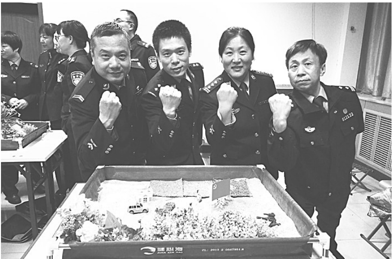
图为民警参加党建团体沙盘训练，精神勃发。

“枯燥难入耳、说教难入心、灌输无针对”，这样的课程越来越不受欢迎。如何在培训中创新，激发党建活力，提升参训警队凝聚力、向心力、战斗力是警校党建培训工作面临的一大挑战。“党建教育从来不是冷冰冰的说教，要有温度、讲深度，把党建课程真正转化为一门生动的实践课程，变‘让我学’为‘我要学’，做好了不但不枯燥，还会聚人气、接地气、提士