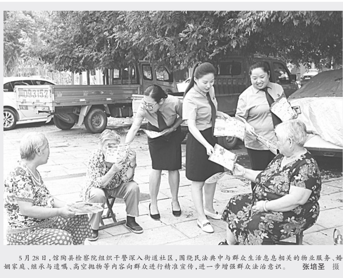
5月28日,馆陶县检察院组织干警深入街道社区,围绕民法典中与群众生活息息相关的物业服务、婚姻家庭、继承与遗嘱、高空抛物等内容向群众进行精准宣传,进一步增强群众法治意识。

“瘦身”钢筋是将正常钢筋拉长后再用于房屋建设,目的是降低建设成本,但使抗震性下降,危及建筑安全。5月21日,鸡泽县检察院联合县市场监督管理局开展“瘦身”钢筋专项检查活动,先后对县域内各乡镇的钢筋销售门市进行抽检,并委托检测科技公司现场抽样送检,确保人民群众房屋建筑安全。