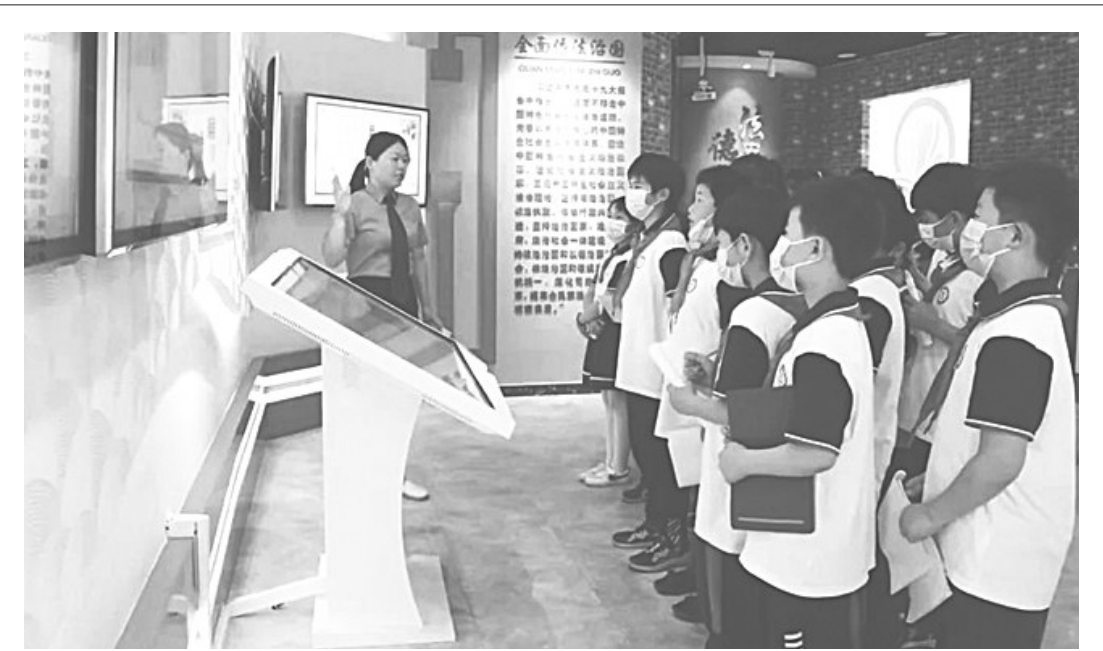
临西县人民检察院以未成年人利益最大化为着眼点,不断延伸检察工作触角,通过开展“木兰普法教育”、心理咨询、问题少年结对帮扶等多种途径,着力构建减少和预防未成年人犯罪工作体系,为未成年人健康成长提供坚强的司法保障,取得了良好法律效果和社会效果。图为6月1日,该院举办检察开放日活动,邀请部分学生进院参观普法基地时的场景。