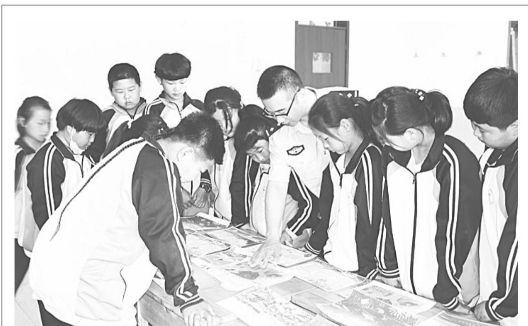
6月8日是世界海洋日。在今年的世界海洋日到来之际,省公安厅海防管理总队秦皇岛支队围绕“保护海洋生物多样性人与自然和谐共生”主题,组织各派出所立足海防工作职责及辖区实际积极开展教育宣传。活动期间,该支队累计开展授课、宣讲等活动10余场次,制作发放各类宣传资料1000余份,受到群众支持好评。图为6月6日,该支队刘台庄海防派出所民警来到辖区刘庄完全小学,为孩子们讲解海洋保护相关知识。

“我希望通过言传身教,影响更多的身边人,把检察官的担当精神传递下去……”她深有感触并满怀期待地说。