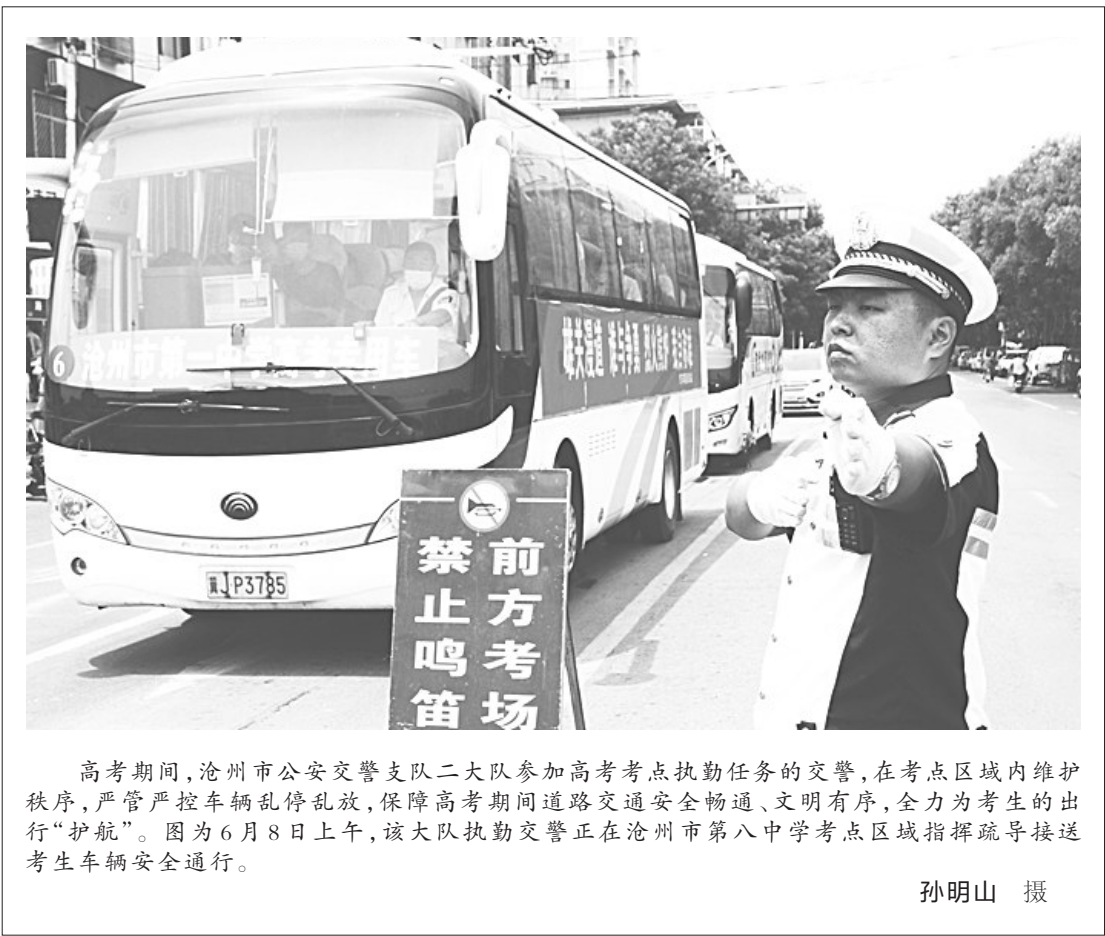
高考期间,沧州市公安交警支队二大队参加高考考点执勤任务的交警,在考点区域内维护秩序,严管严控车辆乱停乱放,保障高考期间道路交通安全畅通、文明有序,全力为考生的出行“护航”。图为6月8日上午,该大队执勤交警正在沧州市第八中学考点区域指挥疏导接送考生车辆安全通行。