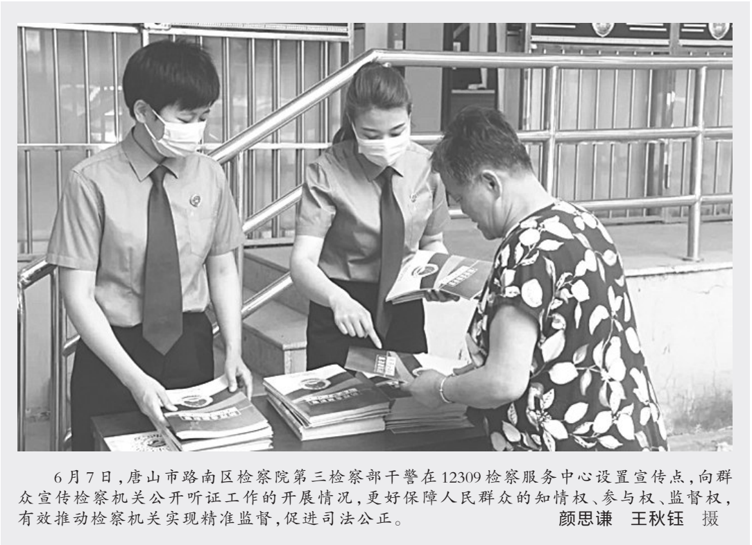
6月7日，唐山市路南区检察院第三检察部干警在12309检察服务中心设置宣传点，向群众宣传检察机关公开听证工作的开展情况，更好保障人民群众的知情权、参与权、监督权，有效推动检察机关实现精准监督，促进司法公正。

近日，武强县检察院联合县公安局开展打击治理电信网络诈骗犯罪集中宣传活动，向群众进行宣讲，将电信诈骗的手段、方式和危害，以通俗易懂的方式讲述给广大群众，进一步增强群众的防范意识。