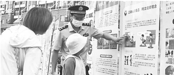
6月26日，秦皇岛市公安局北戴河分局开展了以“严防新型毒品危害，构建绿色无毒港城”为主题的禁毒宣传教育活动。图为民警在为小朋友讲解毒品知识。