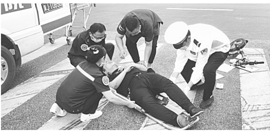
6月24日，在京沪高速公路东光收费站外侧，一辆大货车与一辆电动自行车发生交通事故，骑车人倒地受伤。东光县公安局交警大队民警迅速赶到现场，协助医护人员将伤者抬上救护车。