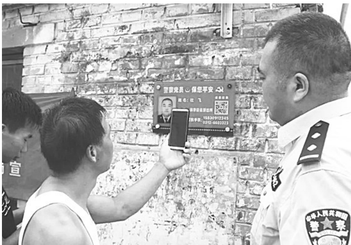
图为民警指导群众扫描警民联系牌上二维码，关注“高阳公安”微信公众号。

警民联系牌上印有党员民警的照片、姓名、联系电话以及“高阳公安”官方微信公众号的二维码。群众在受到不法侵害时，可通过联系牌上的电话第一时间向民警报警求助，也可以随时反映情况，提供线索，让民警及时掌握社情民意，为群