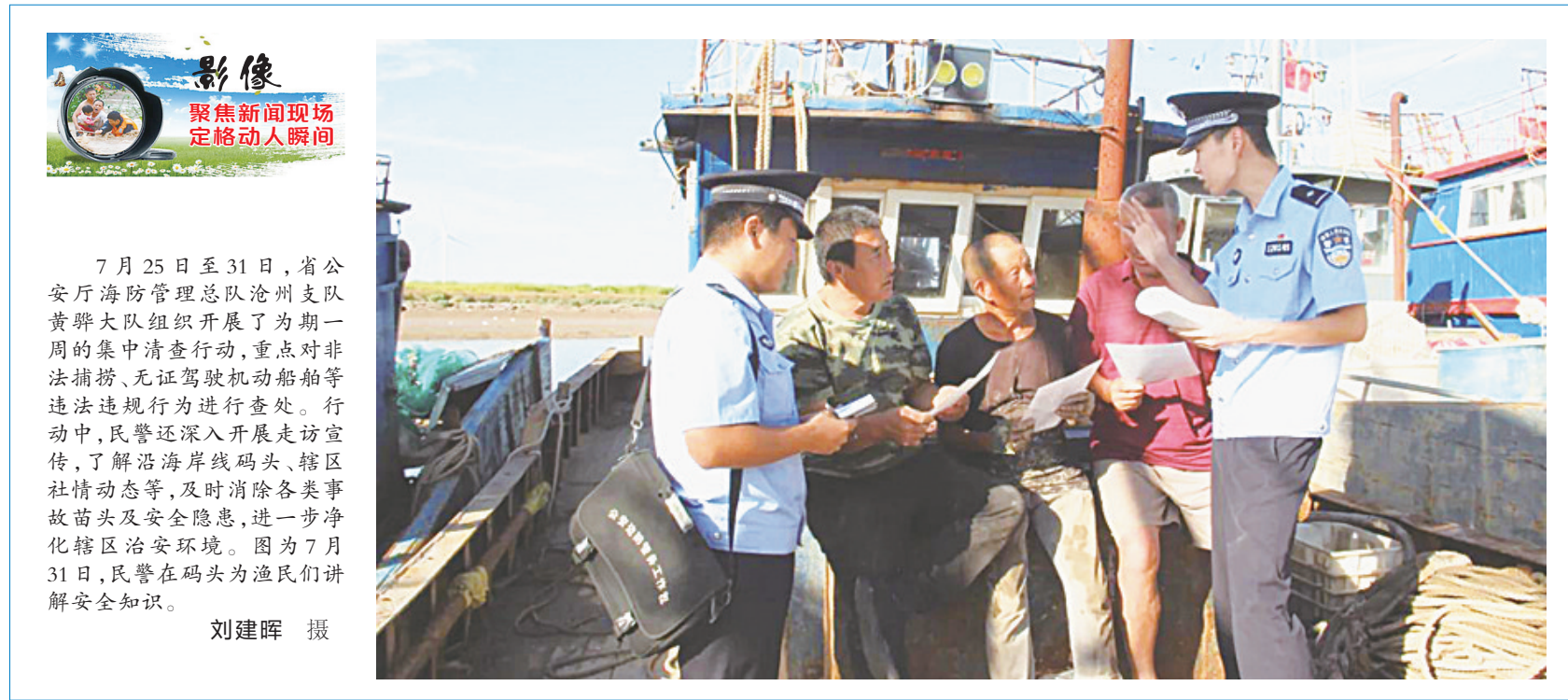
7月25日至31日,省公安厅海防管理总队沧州支队黄骅大队组织开展了为期一周的集中清查行动,重点对非法捕捞、无证驾驶机动车船舶等违法违规行为进行查处。行动中,民警还深入开展走访宣传,了解沿岸岸线码头、辖区社情动态等,及时消除各类事故苗头及安全隐患,进一步净化辖区治安环境。图为7月31日,民警在码头为渔民们讲解安全知识。