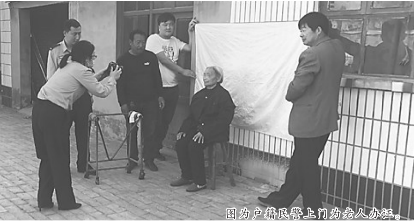
图为户籍民警上门为老人办证。

一砺剑铸盾2021”等专项行动，破获各类民生“小案”310起，9起现行命案即发即破，连克3起命案积案；持续对“食药环”领域突出犯罪保持高压打击态势，共破获刑事案件56起，打掉犯罪团伙10个，捣毁制假窝点20个，涉案金额2000余万元；破获电信网络诈骗案件656起，抓获犯罪嫌疑人537名，打击电信诈骗犯罪保持了破案、抓人同比上升4.2%和27.6%的“双上升”强劲态势。通过一系列严打严治，全市治安秩序持续平稳，刑事警情、治安警情同比下降9.68%和18.5%，积极回应了人民群众的新期待。