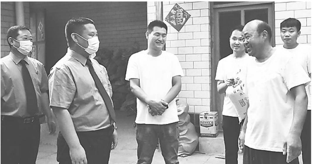
图为检察人员在村民家中了解他们的生产生活情况。

河北法制报讯 (夏伟辉)8月18日,平乡县检察院干警走进乡村开展“访万家”活动,走访慰问困难家庭,着力解决群众的操心事烦心事揪心事,深入推进党史学习教育和“我为群众办实事”实践活动走深走实。