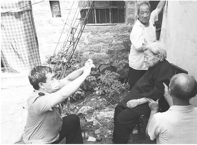
图为信都公安分局皇寺派出所民警为高龄老人上门办理证件。

邢台市公安局各级公安机关在全力推进“燕赵一砺剑铸盾2021”等专项行动中，积极维护人民群众的切身利益，坚持做到“有赃必追，追赃必返”。今年3月份，市公安局刑警支队联合信都分局等成立工作专班，采取视频追踪、蹲坑守候等技战法，先后打掉盗窃电动自行车（三轮车）犯罪团伙6个，破案80余起，追回被盗车辆40余辆。4月7日，公安机关在市体育馆广场举行被盗电动车集中返还认领仪式，将追回的车辆及时返还被盗群众。