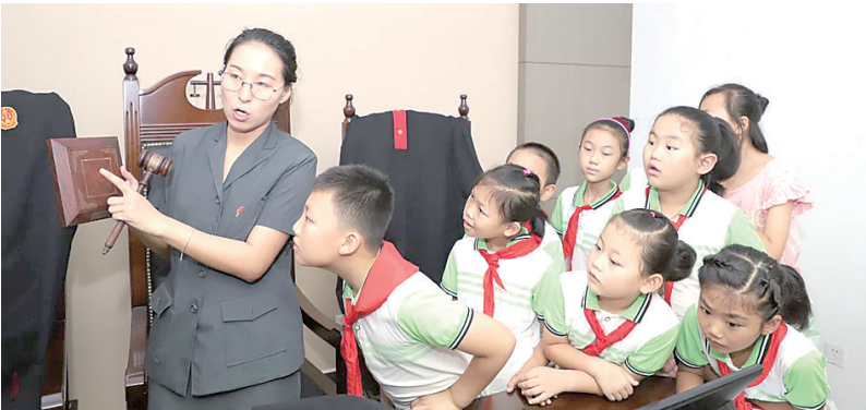
图为唐山中院法官在“法院开放日”为学生们讲解法槌相关知识。

为及时回应群众司法诉求，唐山中院积极优化诉讼服务模式，诉讼服务中心推出一室（母婴休息室）一站（心灵驿站）一家（律师之家）一台（法官值班台）一员（法官联络员）一中心（24小时诉讼服务中心）“六个一”诉讼服务模式，真正实现了“你办事，